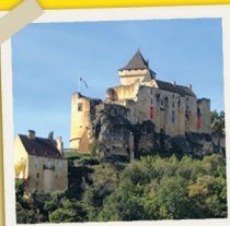
Château de Castelnaud